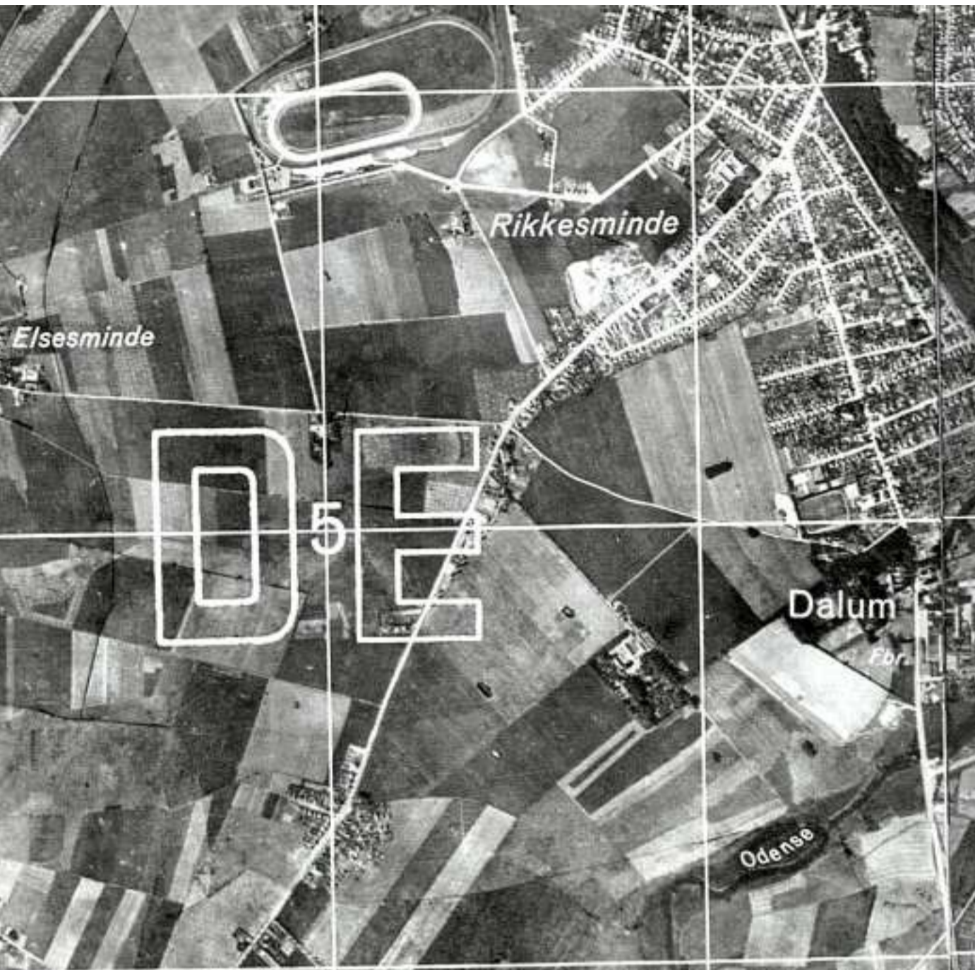
Travbanen lå uden for byen, og man skulle over markerne for at komme til landsbyer som Sanderum og Højme fra Dalum i 1944. De hvide felter på kortene var til militært brug, hvis tyskerne i tilfælde af invasion skulle udpege mål.