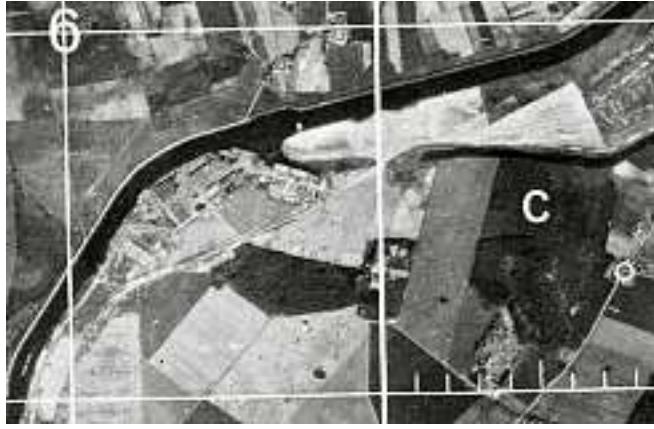
Odense Staalskibsværft tæt på Skibhusene var en af byens store arbejdspladser og særdeles vigtig for tyskerne, der fik repareret skibe på værftet.