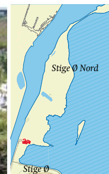
Du må færdes til fods på Stige Ø Nords flotte strandenge